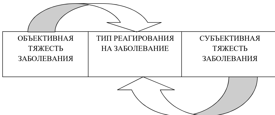
Рис. 1. Зависимость типа реагирования на заболевания от оценки тяжести заболевания

4.17. Теоретическая глава обязательно должна заканчиваться выводами (обычно их три-четыре). В них даются аргументированные ответы на поставленные в главе вопросы. Выделяется существенное, главное как результат исследовательской работы. В любом случае все разделы, пункты и подпункты работы должны быть соединены друг с другом последовательностью текста, без смысловых разрывов.